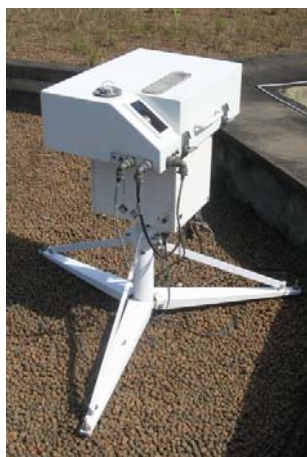
Figura 02 – O Espectrofotômetro Brewer

O espectrofotômetro Brewer (Figura 02) é um instrumento de solo que faz medições de radiação solar, permitindo inferir a coluna total dos seguintes gases atmosféricos: ozônio ( O_3 ), dióxido de enxofre ( SO_2 ) e dióxido de nitrogênio ( NO_2 ). Também pode medir a radiação solar global na banda ultravioleta B (UVB). Este instrumento utiliza a unidade Dobson (UD) para expressar as colunas totais de O_3 , NO_2 e SO_2 . Os cinco comprimentos de onda de operação estão localizados na faixa ultravioleta do espectro de absorção de O_3 e SO_2 , que têm uma forte e variável absorção nas seguintes regiões: 306,3; 310 e 313,5, 316,8; 320nm.