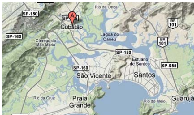
Figura 01 – Localização do estudo

Vários métodos têm sido desenvolvidos para medir não apenas concentrações em superfície, mas também o conteúdo total atmosférico dos gases utilizando instrumentos em solo (Georgoulias et al, 2009). O espectrofotômetro Brewer foi desenvolvido no início dos anos 1980 para medir precisamente o ozônio ( O_3 ) (Kerr et al., 1981), e também calcular o dióxido de enxofre ( SO_2 ), dióxido de nitrogênio ( NO_2 ) e irradiância espectral na faixa do ultravioleta. Este instrumento é amplamente utilizado pela Global Atmosphere Watch (GAW), programa da Organização Meteorológica Mundial (OMM) para medir as colunas de O_3 . Hoje, existem mais de 180 instrumentos instalados ao redor do globo (Fioletov et al., 2005).