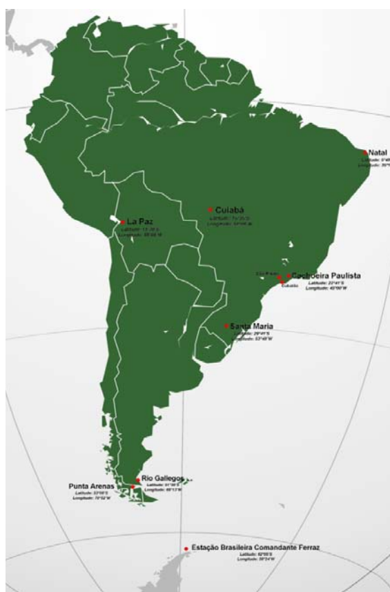
Figura 03 – A rede de Espectrofotômetros Brewer na América do Sul.

O Laboratório de Ozônio, que pertence ao Instituto Nacional de Pesquisas Espaciais (INPE), tem uma rede de Espectrofotômetros Brewer na América do Sul (Figura 03). Os dados apresentados neste estudo foram obtidos em Cubatão-SP, através do método direto ao sol, usando o feixe solar direto como fonte de radiação, em uma campanha no período de 12 de Abril a 07 de Agosto de 2007. Primeiro, os dados coletados pelo Brewer precisam ser reduzidos para que possam ser avaliados. Isso é feito por um programa de análise desenvolvido especialmente para o instrumento. Este programa lê os arquivos do Brewer de acordo com os dados de calibração de cada instrumento. Para a análise dos dados coletados para esta pesquisa, técnicas de estatística descritiva foram utilizadas.