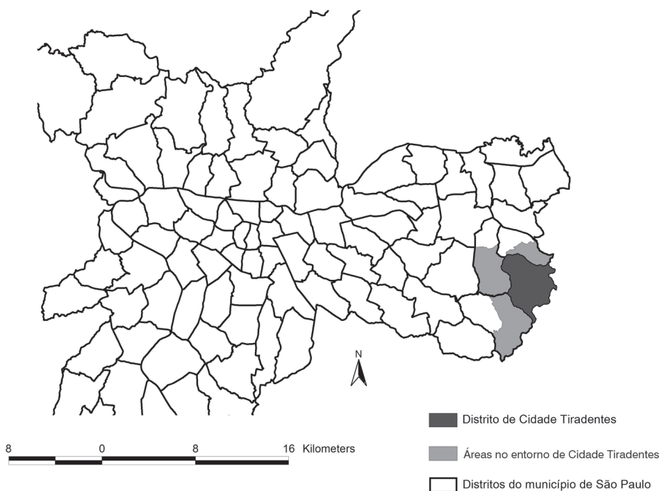
MAPA 1 Região de estudo Distrito de Cidade Tiradentes e áreas no seu entorno