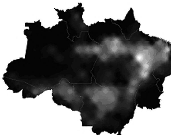
Figura 3 - Distribuição da estimativa de vegetação secundária na AML em km 2

A Figura 3 apresenta a distribuição espacial da vegetação secundária em termos de sua área (em km 2 ) na AML. Nesta figura é possível observar que uma grande área de ocorrência da vegetação secundária se dá na região do “arco do desflorestamento”, embora a proporção da vegetação secundária em relação a área desflorestada seja menor, como observado na figura 2. Isso se dá devido à maior extensão de área desflorestadas nessa região. Outra região que apresenta grande área de ocorrência de vegetação secundária é a calha do médio e baixo Amazonas. Esse padrão pode ser explicado devido ao tipo de ocupação da região por uma população ribeirinha, praticante de uma agricultura de subsistência e itinerante, que tem influência positiva na ocorrência de vegetação secundária (Perz e Skole, 2003; Martins, 2005).