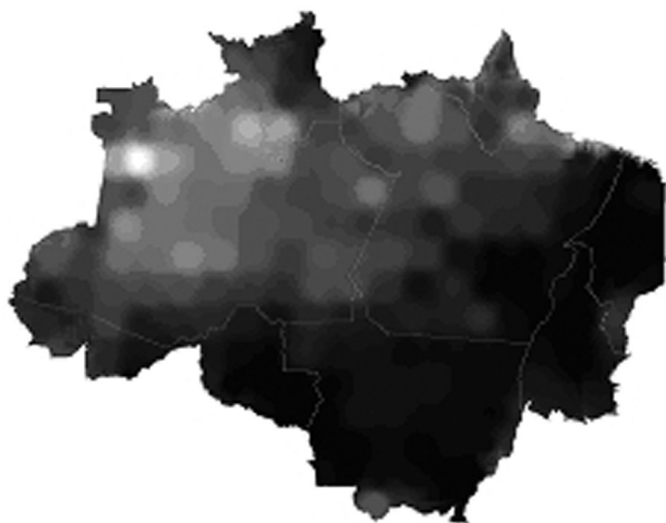
Figura 2 – Distribuição do IVSM na AML

A Figura 2 mostra a distribuição do IVSM estimado, que é maior nas regiões pouco desflorestadas, como o noroeste