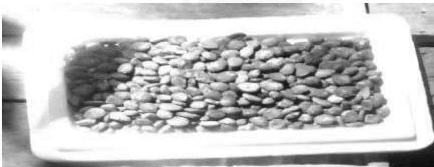
Figura 3 - Secagem das sementes do cupuaçu (em 15 de junho de 2013).

“Nosso produto principal realmente é o cacau, tipo assim, para fazer o chocolate a gente tem que ter essa matéria-prima é essencial e não pode faltar de jeito nenhum”. (Entrevista com Patrícia Costa, 15.06.2013).