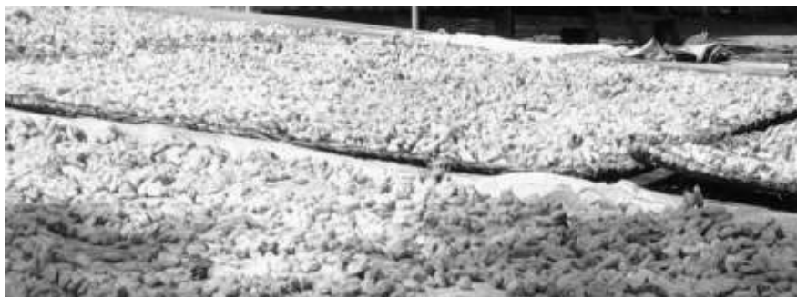
Figura 4 - Secagem das sementes do cacau. (Foto: Isabel Oliveira, em 15 de junho de 2013).