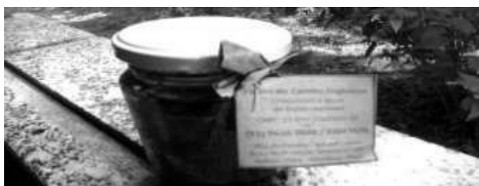
Figura 5 – Doce que será vendido pela Cooperativa em praças públicas de Belém (Foto: Autora principal, em 15 de junho de 2013).