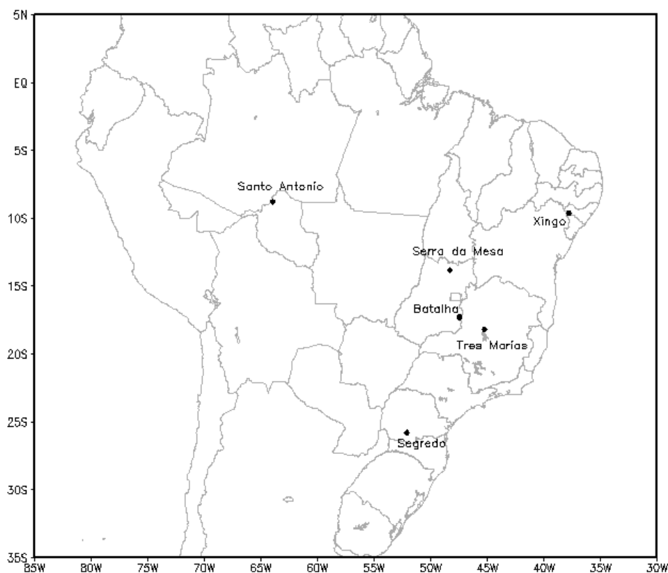
Figura 1. Distribuição dos seis reservatórios estudados neste trabalho.

Foram realizadas quatro campanhas em cada reservatório, com intervalo de três meses entre cada uma, com o objetivo de cobrir todas as estações do ano, observando o ciclo de cheia e seca. No primeiro ano (2011), foram realizadas coletas em Batalha, Santo Antônio, Serra da Mesa e Três Marias, enquanto que Segredo e Xingó foram amostrados durante o segundo ano do projeto (2012). Embora neste período o projeto tenha realizado campanhas em 11 reservatórios, para este trabalho preliminar foram considerados somente os seis reservatórios citados. As principais características de cada reservatório são apresentadas na Tabela 1.