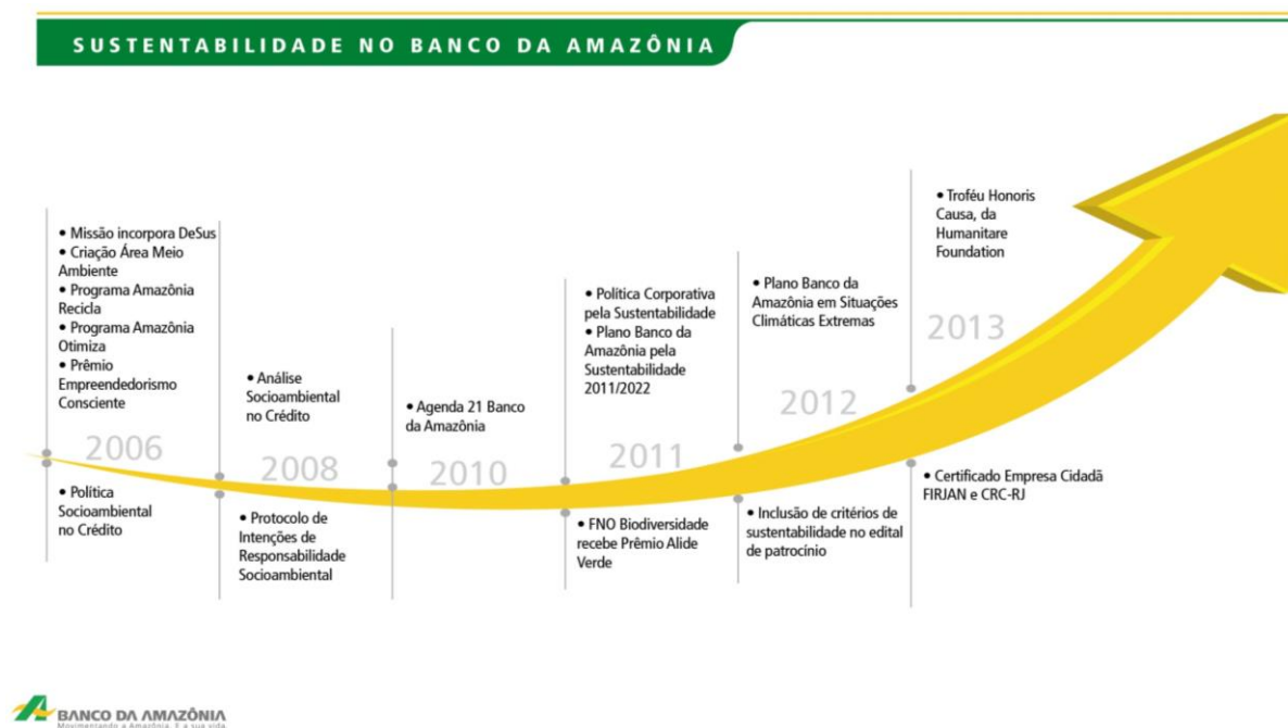
Figura 1: Histórico da política de sustentabilidade no Banco da Amazônia

A partir do século XXI, em virtude da proporção que as questões ambientais assumiram, a Instituição passa por um reordenamento e adota novas políticas, que ultrapassaram o patamar econômico. Nesse sentido, o Banco do Amazônia passou a incorporar à sua política de crédito a responsabilidade socioambiental, dando incentivo e apoio aos projetos que visem o crescimento econômico e baseados no desenvolvimento sustentável da região Amazônica, conforme mostra a figura 1.