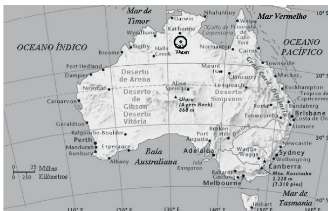
Figura 2. Localização do sítio de observação de Daly Waters.