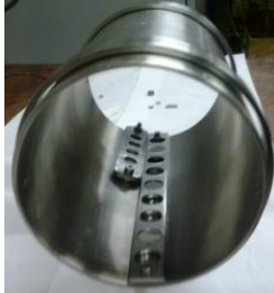
Fig. 1 – Tubo de aço inox com 11 cm de diâmetro e 20 cm de comprimento.

Microscópio Eletrônico de Varredura (MEV) evidenciou, em % atômica, nitrogênio implantado em uma profundidade de até 1µm, como pode ser visto na Tabela 1. O aumento na rugosidade (Figura3) no interior do tubo passou de ( R_a = 3,66 nm) na amostra sem tratamento para ( R_{a1} = 6,87 nm, R_{a2} = 9,60 nm, R_{a3} = 7,60 nm) nas amostras tratadas.